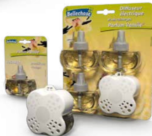
CONFEZIONE BLISTER CON 3 RICARICHE BLÍSTER CON 3 RECARGAS