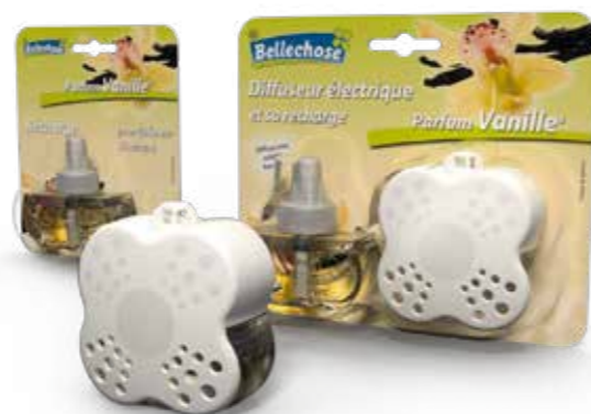
CONFEZIONE BLISTER BLISTER